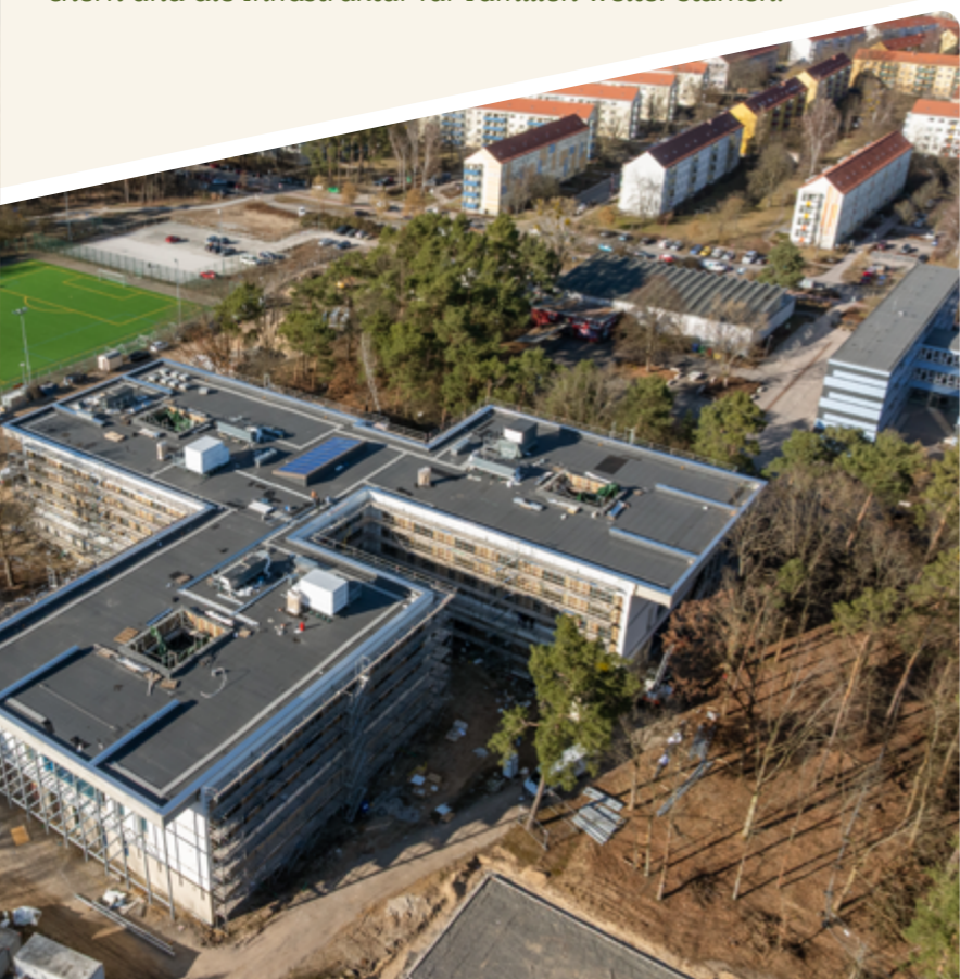
Schule im Kiefernwald