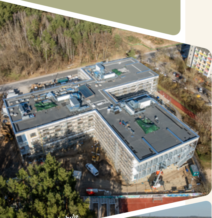
Regenbogen-Grundschule Sporthalle am Brunnenpark

Beide Schulen sowie die Sporthalle am Brunnenpark sollen pünktlich zum neuen Schuljahr ihren Betrieb aufnehmen. So entstehen zeitgemäße Bildungs- und Bewegungsorte, die das Quartier nachhaltig bereichern und die Infrastruktur für Familien weiter stärken.