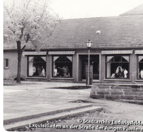
Exquisitladen an der Straße der Jungen Pioniere

Ihre Ideen und Anregungen sind uns wichtig. Schreiben Sie uns eine E-Mail an marketing@maerkische-heimat.de – wir hören Ihnen gern zu.