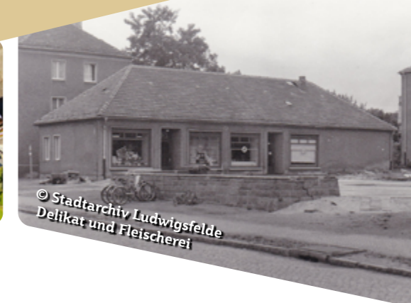
© Stadtarchiv Ludwigsfelde Delikat und Fleischerei

können teilnehmen, eigene Geschichten einbringen oder einfach vorbeikommen und den Ort neu erleben.